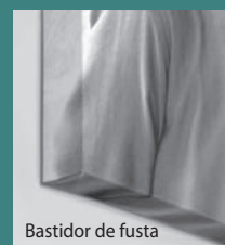
Bastidor de fusta

Totems de fàcil i ràpid muntatge i del tipus enrotllable. De 85 a 150 cm d'amplada i 220 cm d'alçada. Molt pràctics per a fires, presentacions de producte i publicitat.