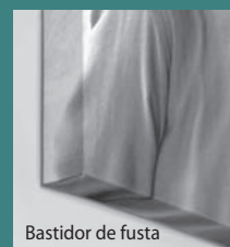
Bastidor de fusta

Totems de fàcil i ràpid muntatge i del tipus enrotllable. De 85 a 150 cm d'amplada i 220 cm d'alçada. Molt pràctics per a fires, presentacions de producte i publicitat.